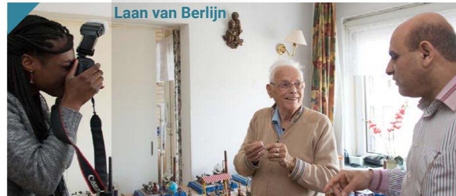
Laan van Berlijn